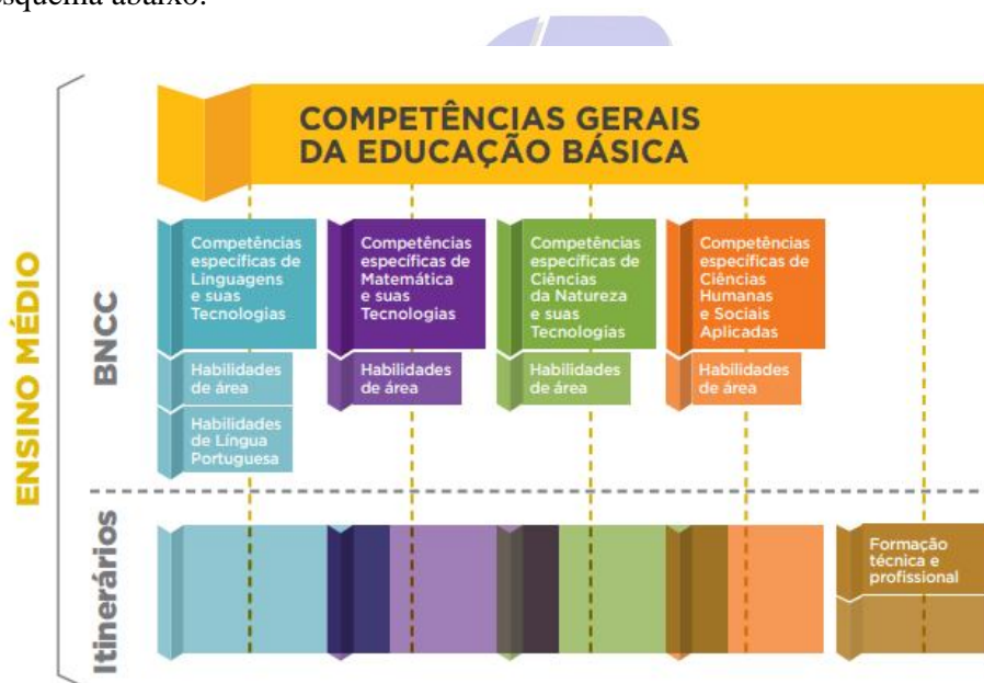
Figura 2. Competências Gerais da Educação Básica

Os itinerários formativos podem ser configurados a partir de cinco possibilidades, com base nas competências e habilidades em cada uma das quatro áreas da Base Nacional Comum Curricular (Linguagens e suas Tecnologias, Matemática e suas Tecnologias, Ciências da Natureza e suas Tecnologias e Ciências Humanas/Sociais e suas Tecnologias); ou com ênfase na formação técnica e profissional. Conforme esquema abaixo.